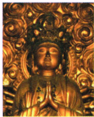
御本尊 十一面千手千眼 観世音菩薩