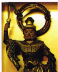
脇侍:將軍地藏大菩薩