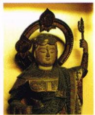
脇侍:勝敵毘沙門天王

当山ご縁日は毎月二十一日(お大師さん)で、柳谷観音の信者がお参りになり、眼病諸病平癒のご祈禱をし、柳谷観音独特の百万遍念仏勤行式を唱えあげ、平和安穩、諸願成就を願いつつ、先祖供養、念仏三昧の一日を過ごし、観音様の慈悲の心に浸る。