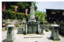
泰聖寺観音納骨堂